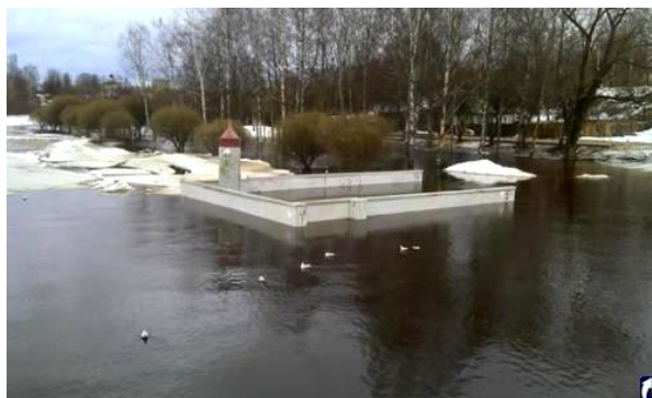
Фото 1. Смотровая площадка на левом берегу Псковы, центр города Пскова

Представленные ниже снимки р. Псковы были сделаны в апреле 2011 г. (фото 1), марте 2016 г. (фото 2) и в августе 2017 г. (фото 3). Фотографии 2, 3 были сделаны в пригороде Пскова практически с одной точки. В момент съемок уровень реки превышал среднегодовой. Приведите термины с определениями, характеризующие различный уровень воды в реке. Определите явления в природе, зафиксированные на фото 1-3, назовите причины.